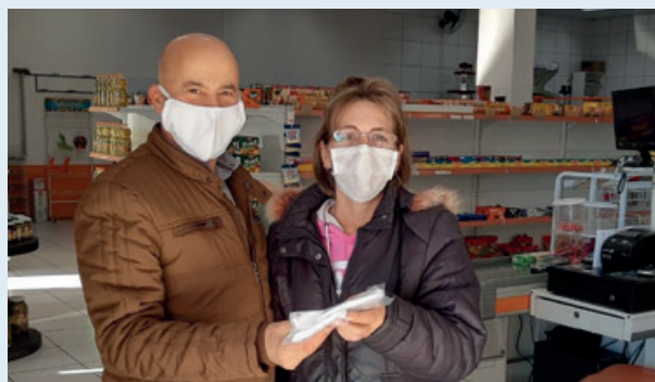
ENTREGA NO MERCADO MENGARDA, BAIRRO 25 DE JULHO

Por esse motivo, confeccionou 2.700 máscaras e distribuiu em diversos mercados pelos bairros de São Bento do Sul e Fragosos para que os mesmos repassem à comunidade gratuitamente.